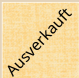
VA – vanille