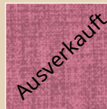
HI – himbeer