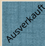
D – denim