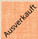
PC – peach