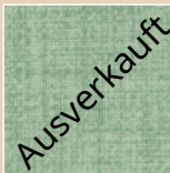
SL – salbei