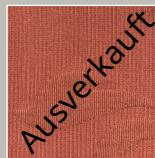
KR – koralle