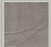
GY – grey