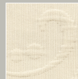
IV – ivory