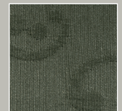
OL – oliv