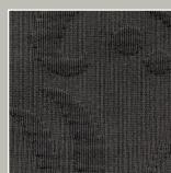
AZ – anthrazit