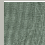
JA – jade