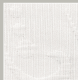
WS – weiß