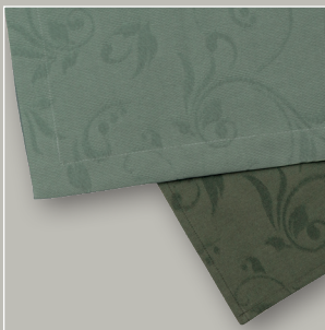
SCALA mit Gehrungssaum SCALA-D schmal gesäumt