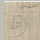
KL – kiesel