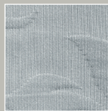
ST – stone