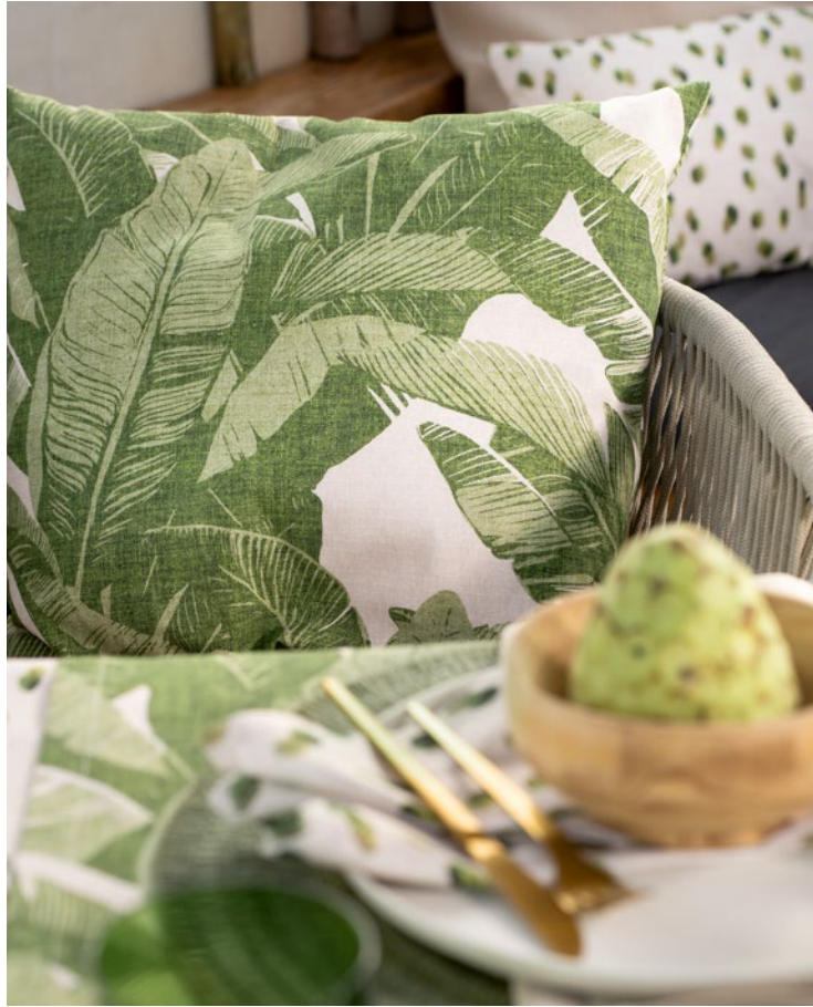
Oliv küsst Bernstein